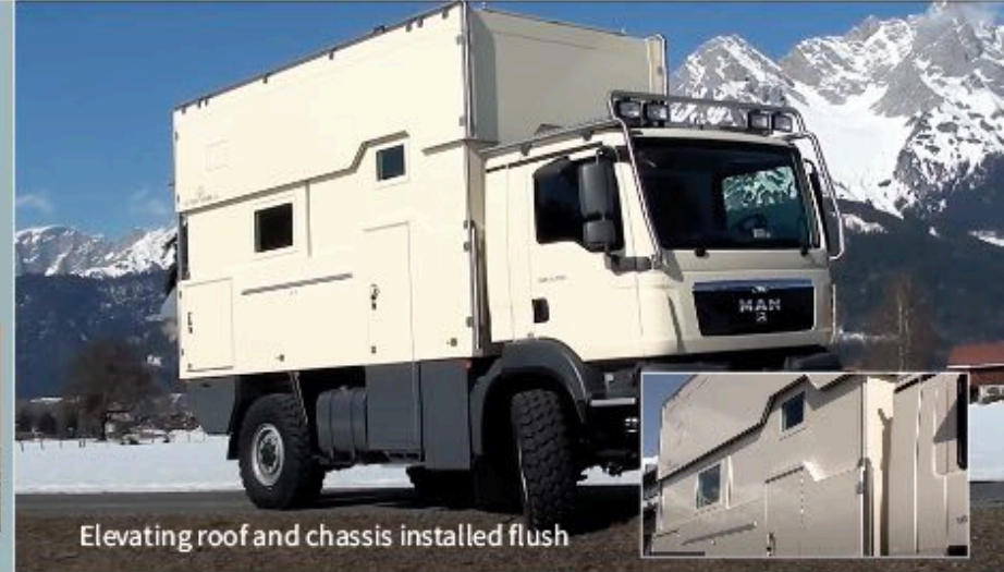
Elevating roof and chassis installed flush

« Vivre au lieu de camper » Quel luxe souhaiter en plus ?